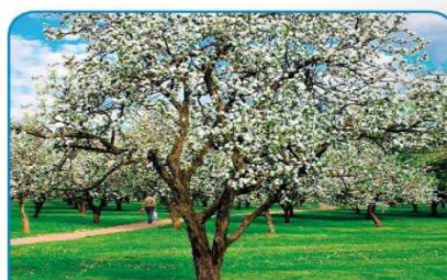
Spomladi drevo zeleni in cveti.