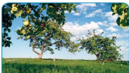
Poleti je drevo polno zelenih listov in tudi nezrelih sadežev.