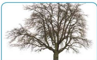
Sadno drevo pozimi počiva.

1. V zvezek »okoljček« napiši naslov z rdečo barvico Sadno drevo in datum ter prepiši spodnje besedilo in nariši sličice (lahko ga tudi natisneš in prilepiš).