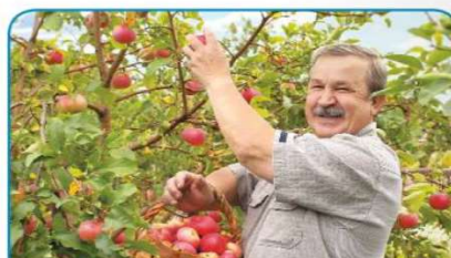
Jeseni na jablani dozoriijo jabolka.